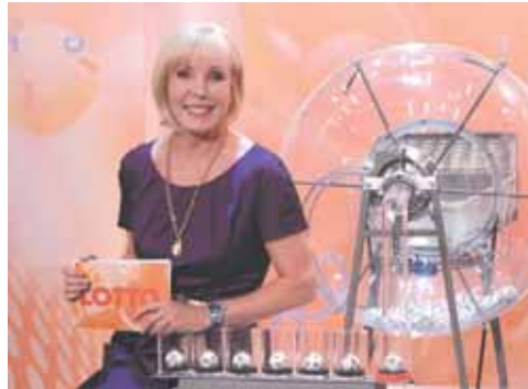
LOTTO-Fee Heike Maurer verkündete am vergangenen Mittwoch im ZDF die Zahlen, mit denen ein Spielteilnehmer aus Bayern den Jackpot in Höhe von rd. 31,7 Mio. € geknackt hat.

Ein Spielteilnehmer aus Oberbayern hatte als Einziger in ganz Deutschland die sechs Richtigen und die gezogene Superzahl auf seiner Spielquittung. Auf den Gewinner